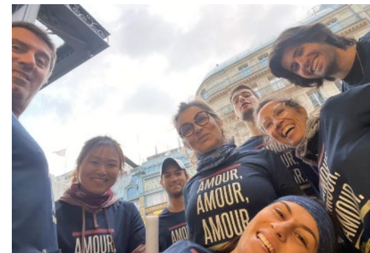
Course des lumières 2022

Dons de vêtements à la Cravate Solidaire 2022