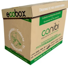
ECOBX 100 litres 45 cm X 60 cm X 40 cm

Dès la première collecte (*), nous vous livrons des contenants adaptés pour regrouper vos consommables usagés :