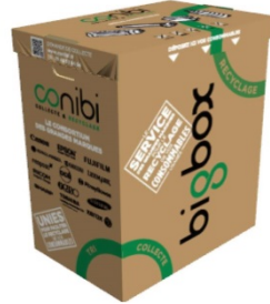
BIGBOX 150 litres 70 cm X 60cm X 40cm